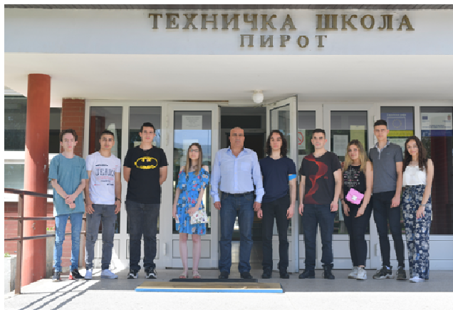
Успешни учесници републичких такмичења у школској 2020-2021.